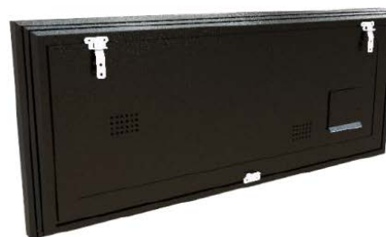
TRASERA MODELOS RT31-RT40