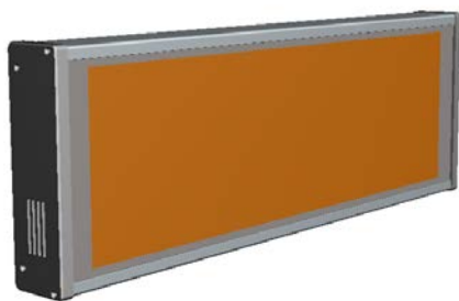
FRONTAL MODELO RT21