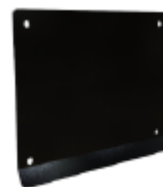
Tapa de conexiones