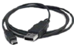
Cable mini USB