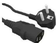
Cable de red