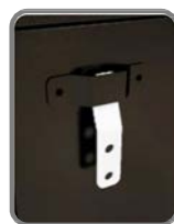
Detalle del anclaje