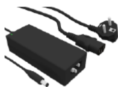
Cable de red