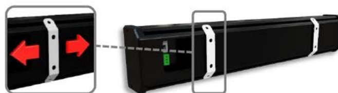
Detalle del anclaje