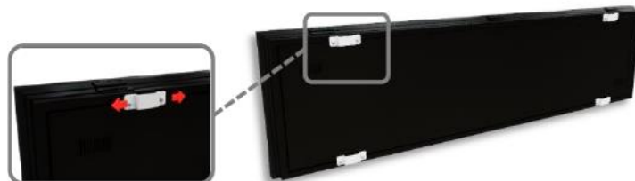
Detalle del anclaje