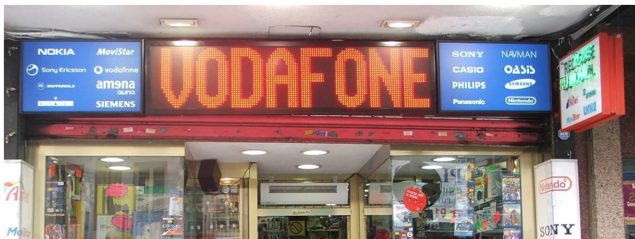
EJEMPLO PANEL MONOCROMO

Es un producto ideal para la señalización de parkings, por ejemplo indicando abierto o cerrado; la industria, como contador de piezas correctas e incorrectas; como también para el direccionamiento de personas o vehículos, como estaciones de carga o descarga