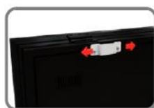
Detalle del anclaje