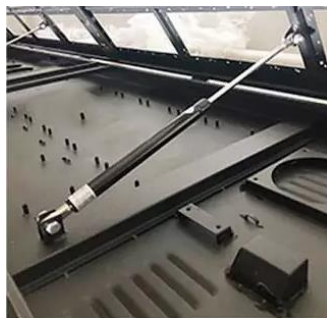
Muelle por gas