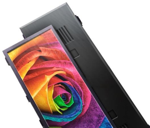
Rótulo Full-Color Exterior

Esta nueva tecnología modular sustituye los rótulos convencionales que solo podían colocar una imagen iluminada. Con los rótulos LED electrónicos las posibilidades son tan infinitas como su contenido.