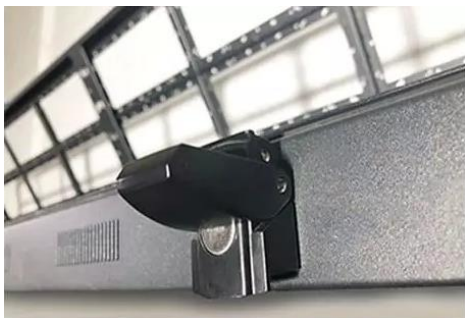
Cierre de seguridad