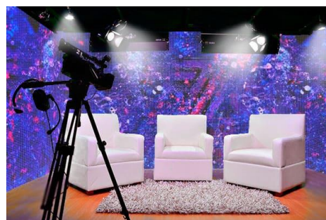
Multitud de aplicaciones