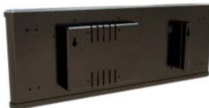
EJEMPLO RELOJ REL80