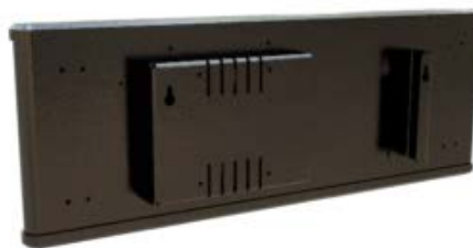
TRASERA MODELO REL80