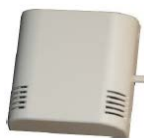
Sonda de temperatura