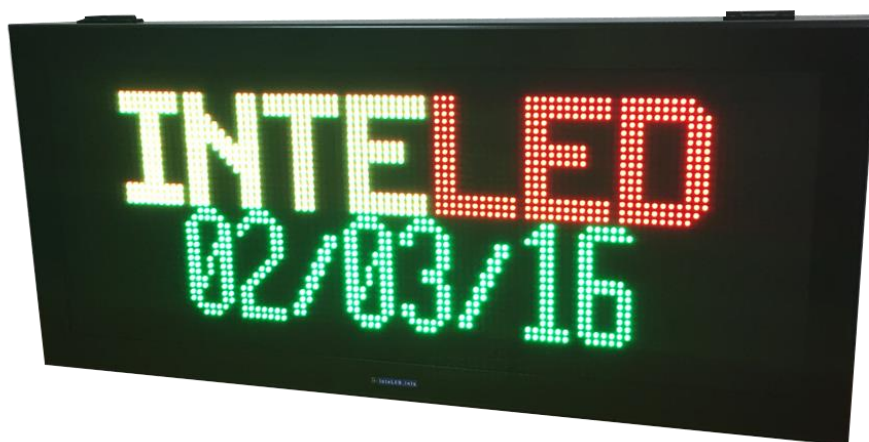
EJEMPLO PANEL TRICOLOR

Es un producto ideal para la señalización de parkings, por ejemplo indicando abierto o cerrado; la industria, como contador de piezas correctas e incorrectas; como también para el direccionamiento de personas o vehículos, como estaciones de carga o descarga