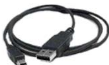
Cable mini USB